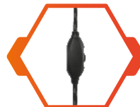
CONTROLADOR DE VOLUMEN