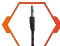
CONEXIÓN AUX 3.5mm